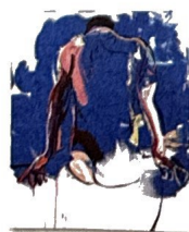
Berückend: „Back into Blue Void II“ in der Berliner Schau